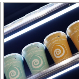
LED-Beleuchtung unter jedem Rost