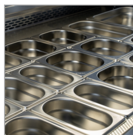
Model dostosowany do pojemników GN 1/1 (pojemniki nie znajdują się w zestawie)