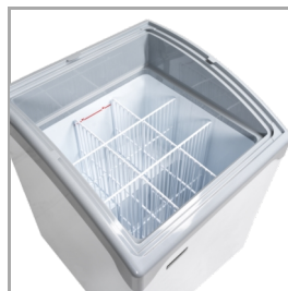
Système de cloisons