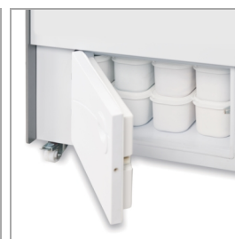
Komora magazynowa o łatwym dostępie