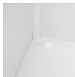
Ablauf der Abtauung