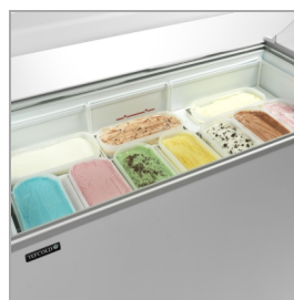
Na objednávku: koš na vaničky na zmrzlinu