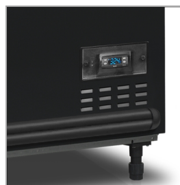
Digitální ukazatel teploty