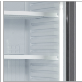
Svislé vnitřní osvětlení