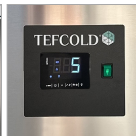
Digitální řídicí jednotka