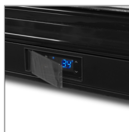
Skyddshölje på termostat