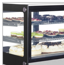
Expositor de pastelería