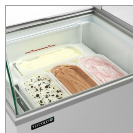
Halterungen für Eisschalen als Option