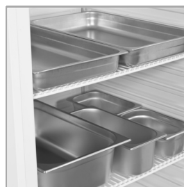
Conçu pour des bacs GN1/1, non fournis