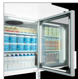
LED-Beleuchtung im Türrahmen