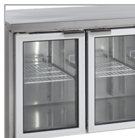
Aluminiowe obramowania drzwi i