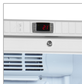
Thermostaat met hoorbaar en extern alarm