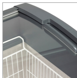
Bezrámové prosklené posuvné víka