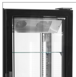
Puerta sin marco