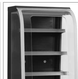
Półki regulowane z funkcją przechylania