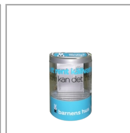
Für Branding geeignet