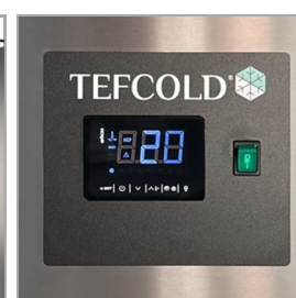
Digitální řídicí jednotka