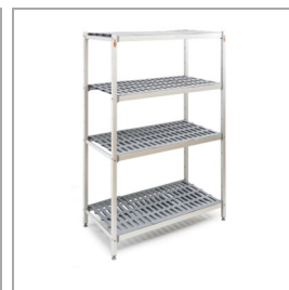
Estante como accesorio