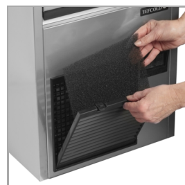
Filtre de condenseur facile à nettoyer