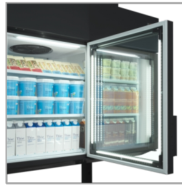
Éclairage LED dans le cadre de la porte