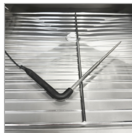
Sonda de núcleo incluida