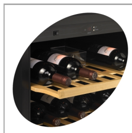
Utdragbara hyllor i trä