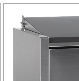
Roestvast stalen deksel voor bescherming van voedsel