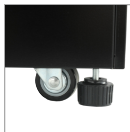
Koleščka in blokirne noge